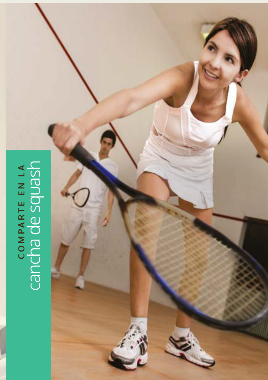
COMPARTE EN LA cancha de squash