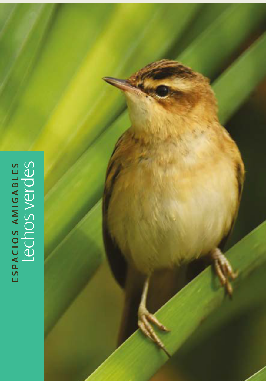
ESPACIOS AMIGABLES techos verdes

Contarás con zona cardio, cancha de squash, senderos ecológicos y espacios más amigables con el medio ambiente.