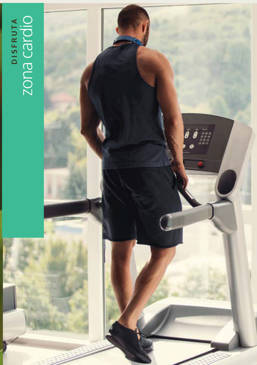
DISFRUTA zona cardio