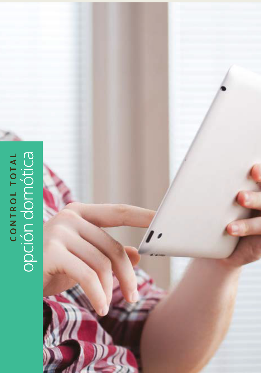
CONTROL TOTAL opción domótica

Contarás con domótica, piscina climatizada, putting green, ventilación natural y mucho más.