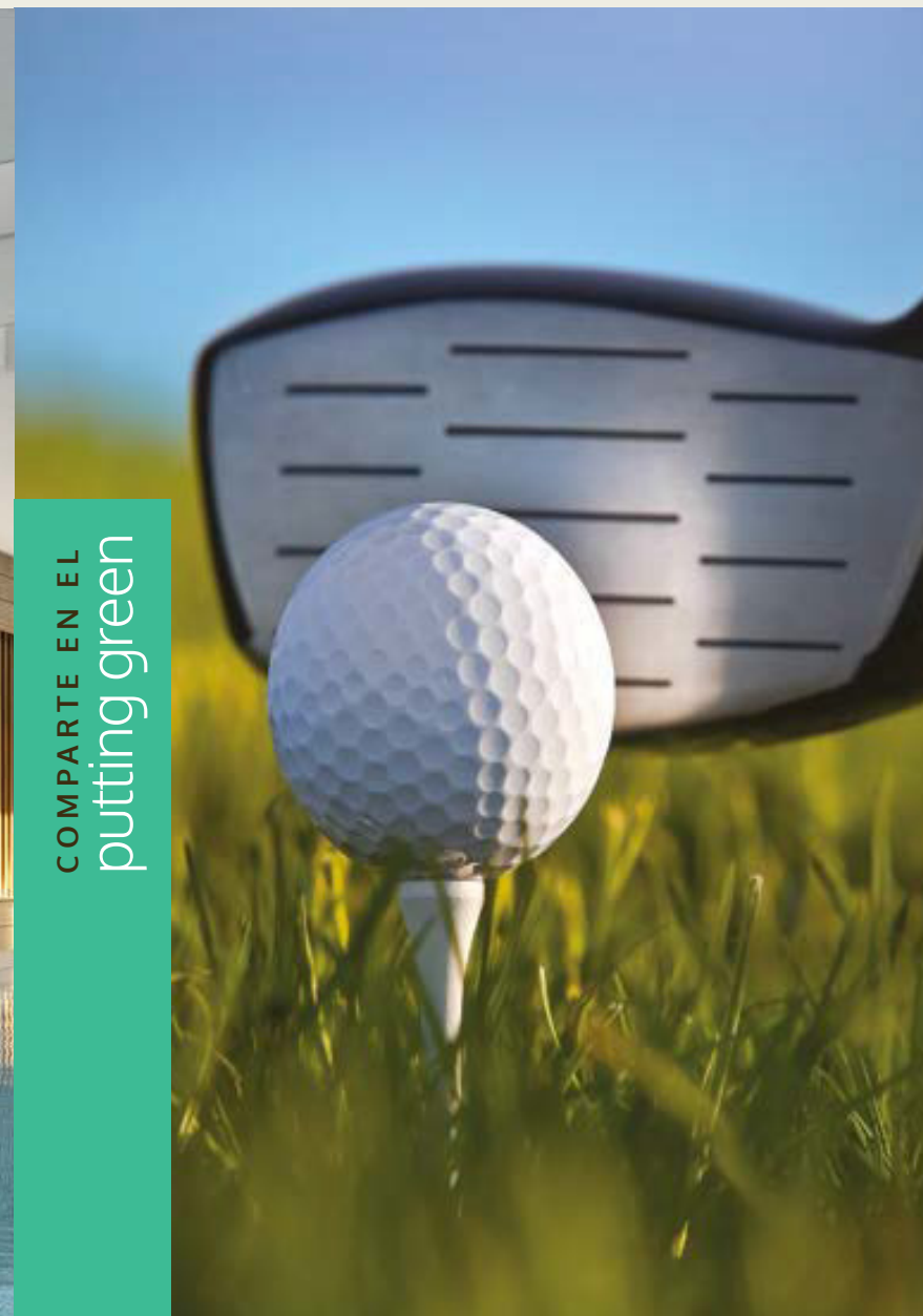
COMPARTE EN EL putting green